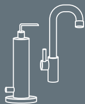
家庭用除水器 ウォーターサーバー